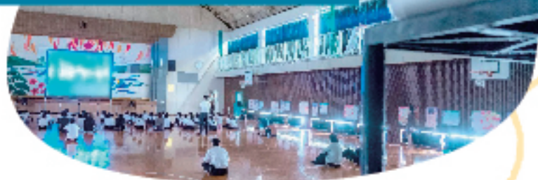
ワークシートを使用した 鑑賞ワークショップ