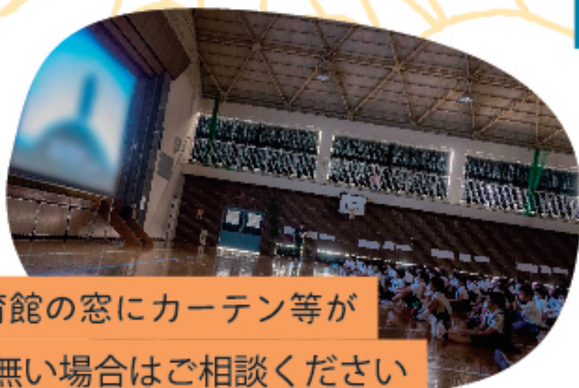
体育館の窓にカーテン等が 無い場合はご相談ください