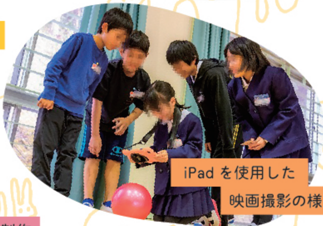
iPadを使用した 映画撮影の様子