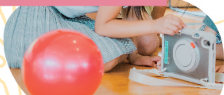
赤いボールを主人公にした 『赤いボールの冒険』を制作