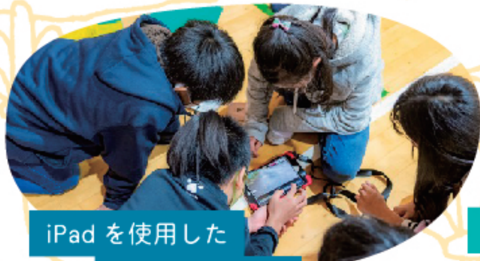
iPadを使用した 映画編集の様子