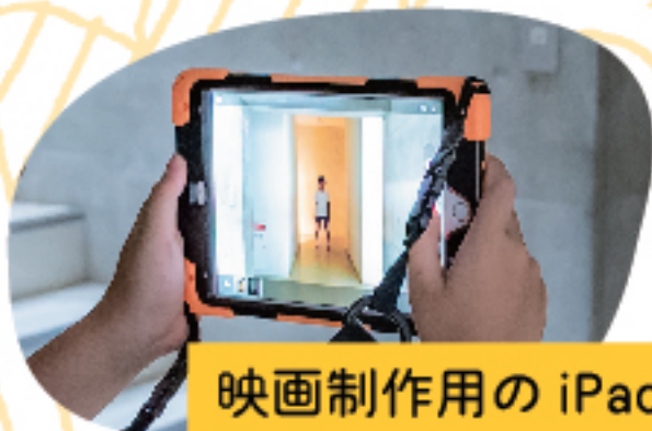
映画制作用の iPad は 当団体で用意します