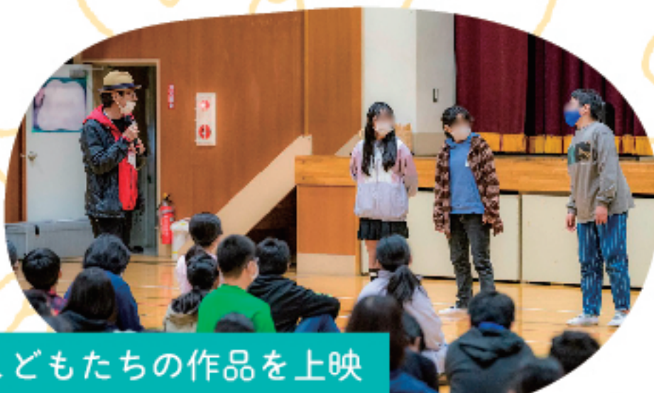
こどもたちの作品を上映 映画監督と対話をしながら舞台挨拶